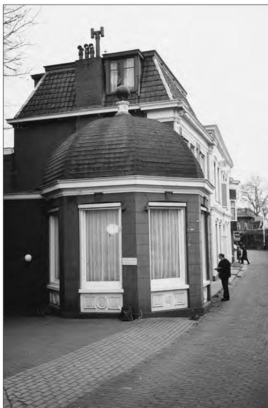
Afb. 2. Hereweg 2.