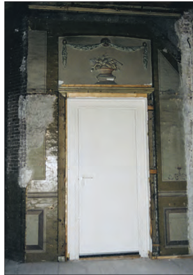
Afb. 4. Hereweg 2, oostelijke ingang van de tuinkoepel.

Binnenkort wordt getracht de koepel, met name wat betreft het interieur, deels in oude luister te herstellen. De eens zo rustieke plant- en boomrijke omgeving van de koepel is definitief verloren gegaan, maar de glorierijke uitstraling van het gebouw kan hiermee gedeeltelijk herleven.