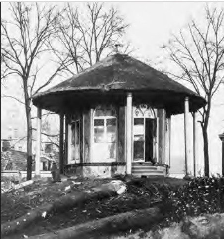
Afb. 1a. Tuinkoepel behorende bij een pand aan de Nieuwe Weg, ter hoogte van het huidige nummer 20, circa 1910.

Binnen het scala aan kleinere bouwwerken dat de laatste eeuwen in ons land is verrezen en dat tot in onze tijd bewaard is gebleven, spreekt de tuinkoepel, met zijn romantische uitstraling, velen tot de verbeelding. In tegenstelling tot de meeste andere kleinere architectuur uit het verleden, zoals bijvoorbeeld stookhutten, transformatorhuisjes of schaapskooien ontbreekt bij de tuinkoepel een directe economische aanleiding tot de bouw. Tuinkoepels hadden een puur recreatieve functie en werden gebouwd als uiting van welstand, luxe en overvloed (afb. 1a en 1b). De koepels werden uit hout, maar ook vaak uit steen opgetrokken waarmee de grandeur van de koepel werd benadrukt. Het grondplan van de koepel was altijd symmetrisch, waarbij een zes- of achthoekige plattegrond overheerste. Het open karakter van het gebouw werd benadrukt doordat de tuinkoepel meestal geheel rondom van ramen was voorzien. Onderkeldering was geen uitzondering. Het bood de eigenaar de mogelijkheid om bijvoorbeeld tuinopbrengsten of een wijnvoorraad op te slaan. Daarnaast werden koepels soms gebouwd met een verdieping, zodat men zich niet hoefde op te houden in één enkele koepelkamer. Ook waren de koepels regelmatig