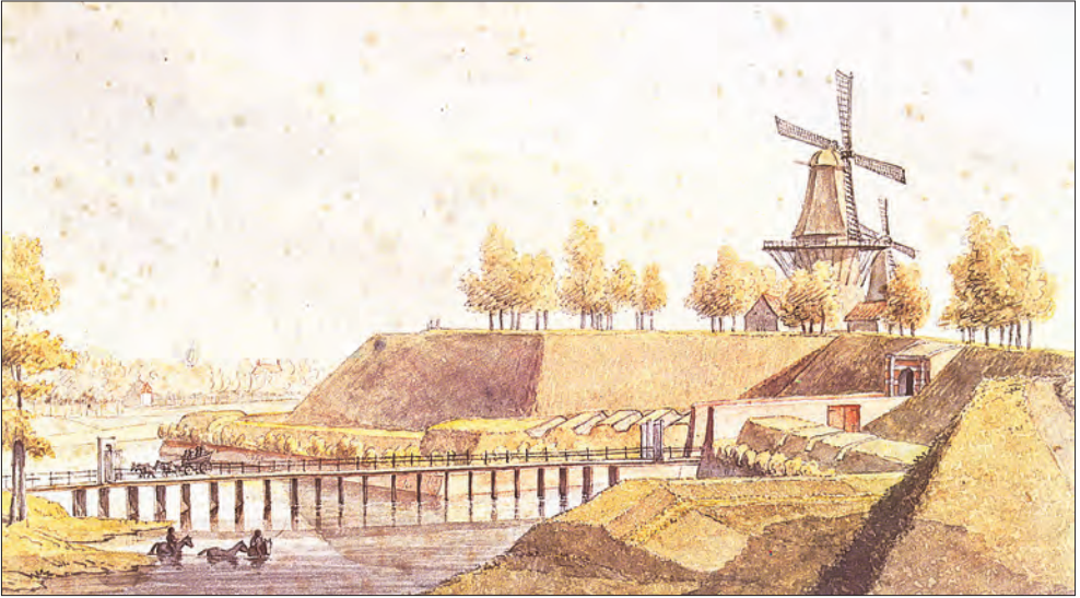
Afb. 5. Onder de Boompjes met koepel en stadswal met molen, 1825, aquarel. Uit: Schuitema Meijer, 1976, 69.

's Zomers moet de lucht hier verzadigd zijn geweest van bloemengeuren en zal het geheel een kleurrijk aanzien hebben gehad. Een zondagse wandeling werd dan begeleid door het gezoem van de bijen, afkomstig uit de talrijke bijenkorven die hier door imkers waren uitgezet. De meeste tuinen waren voorzien van een tuinhuis, soms met één of meer verdiepingen, opgetrokken uit hout, steen of een combinatie van beide. De tuinkoepels waren ook ruim vertegenwoordigd, vaak gelegen op de meer prominente plaatsen zoals op hoekpercelen en langs de wandelwegen waar het uitzicht goed was. Op de 19e-eeuwse kadastralokaarten zijn met name langs Onder de Boompjes de achthoekige tuinkoepels opvallend aanwezig (afb. 6).