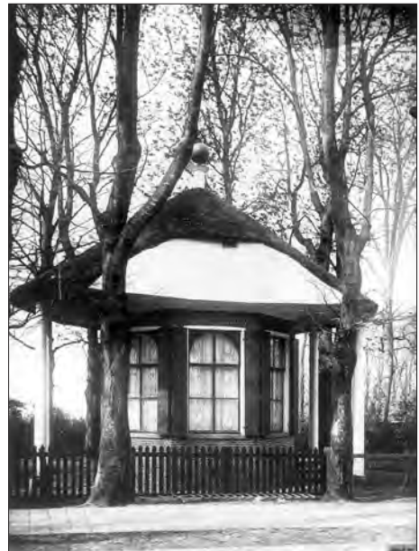
Afb. 1b. De tuinkoepel Hereweg 122/2, vóór verplaatsing.