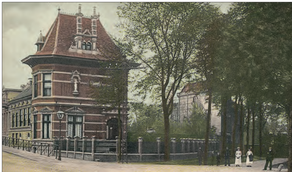
Afb. 8. Tuinkoepel Hereweg 1/1a, 1901.