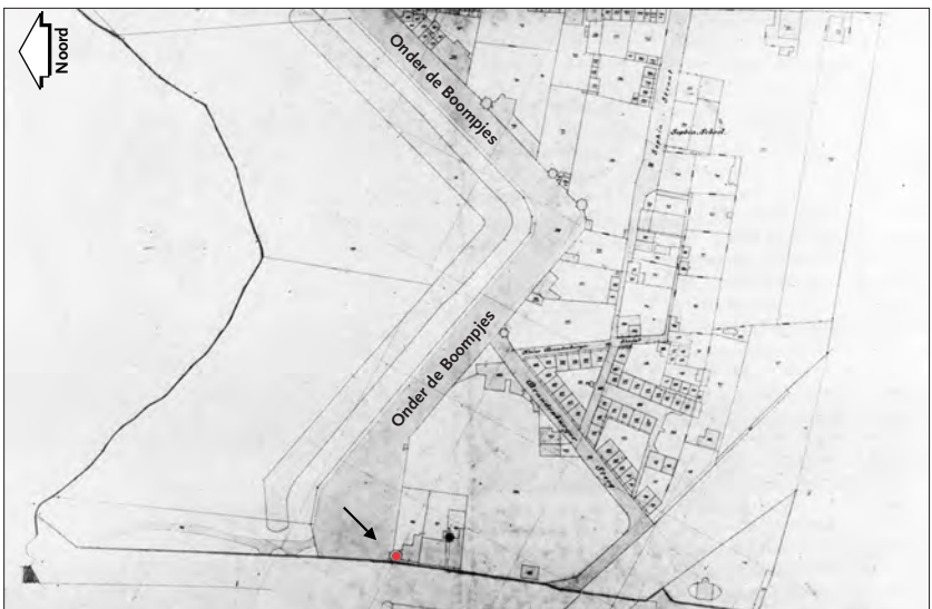
Afb. 6. Kadastrale minuut uit 1872 met daarop Hereweg 2 (zie pijl). Uit: Offerman, 1987, 47.

Binnen de verdedigingswerken van de stad bood vooral de ruim opgezette 17e-eeuwse stadsuitleg, de Hortusbuurt, mogelijkheden voor tuinaanleg. In deze