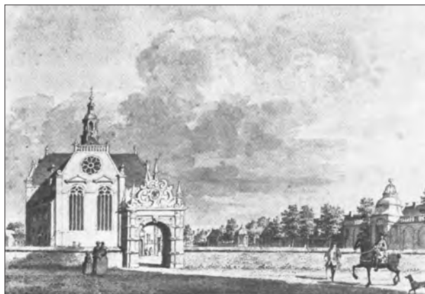
Afb. 7. Zicht op de Nieuwe Kerk, bij de tuinmuur de koepels Marktstraat 19 (links) en Ossenmarkt 4 (rechts), 1754. Pentekening: C. Pronk. Uit: Schuitema Meijer, 1976, 143.

omgeving was in het verleden dan ook een aantal tuinkoepels gelegen. Een mooi voorbeeld is de 18e-eeuwse koepel die behoorde bij Marktstraat 19 en in circa 1929 is gesloopt (afb. 7).